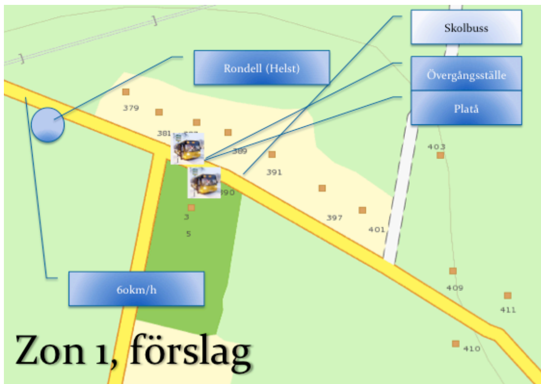
Bild 2 Förslag, zon 1

Anlägg överkörningsbar rondell (helst) som är anpassad för lantbruksmaskiner, eller en effektiv byport för hastighetsbegränsning. En idé som också luftades i sammanhanget var att anlägga en rondell mitt på raksträckan i Zon 1 eftersom det effektivt skulle minska farten genom byn.