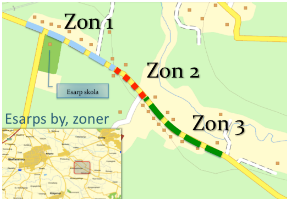
Bild 1 Zoner som väggruppen delat in byn i

Esarps by delades in i tre zoner för att skapa tydlighet i materialet