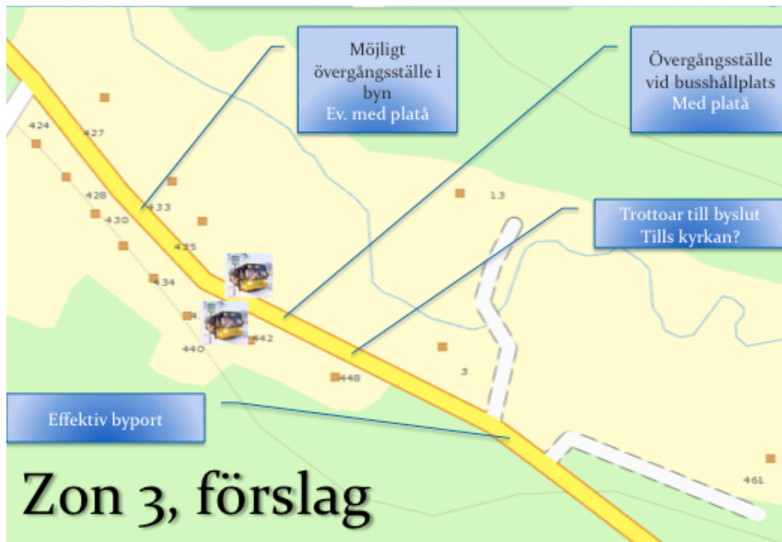
Bild 4 Förslag, zon 3

Skapa en effektiv byport i östra infarten, där det är lämpligt och synligt.